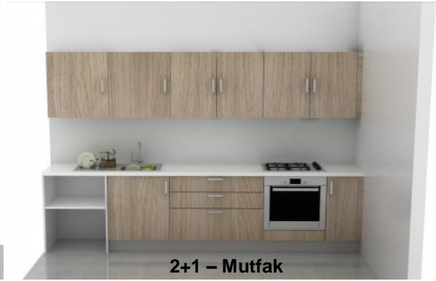
2+1 – Mutfak