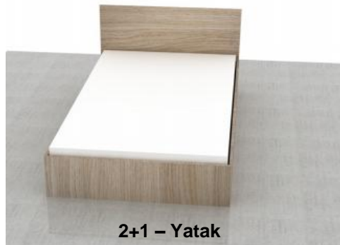
2+1 – Yatak