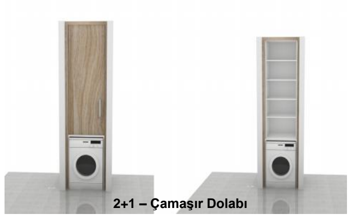
2+1 – Çamaşır Dolabı