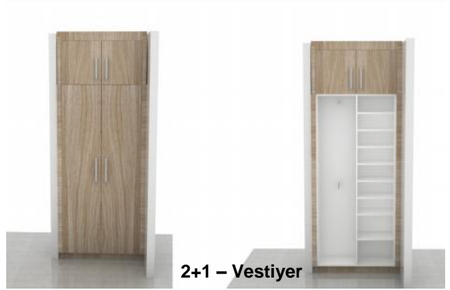
2+1 – Vestiyer