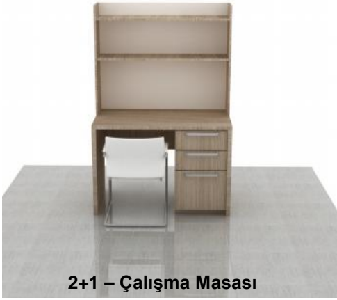
2+1 – Çalışma Masası