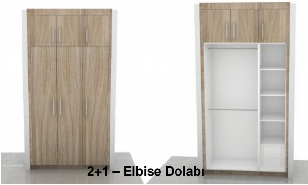
2+1 – Elbise Dolabı