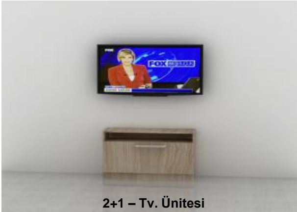
2+1 – Tv. Ünitesi